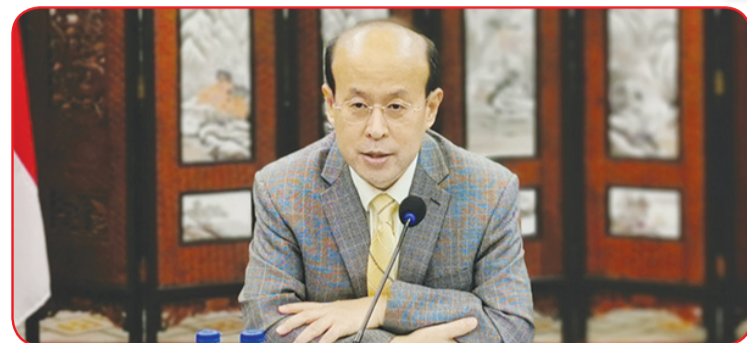
Dubes Tiongkok untuk Indonesia Xiao Qian.