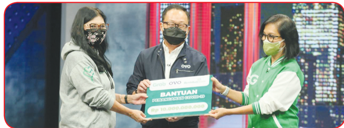
Penyerahan sumbangan secara simbolis.