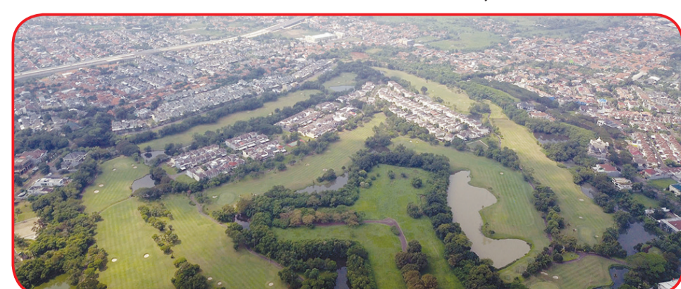
Kawasan Kota Modern.