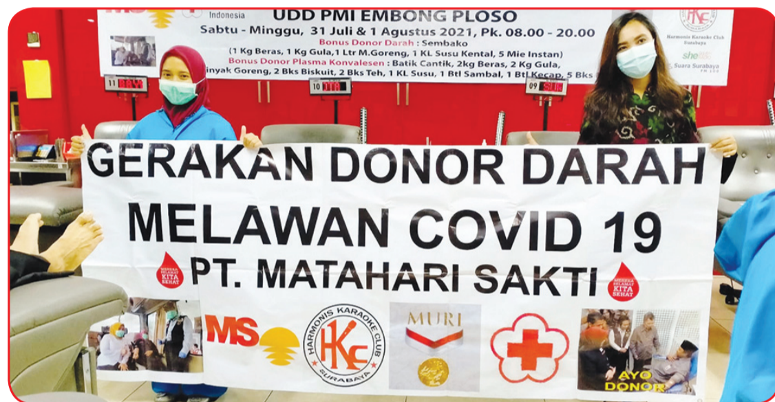
Perwakilan panitia berfoto bersama.