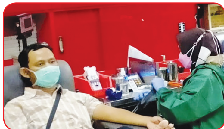
Petugas melayani peserta donor darah.