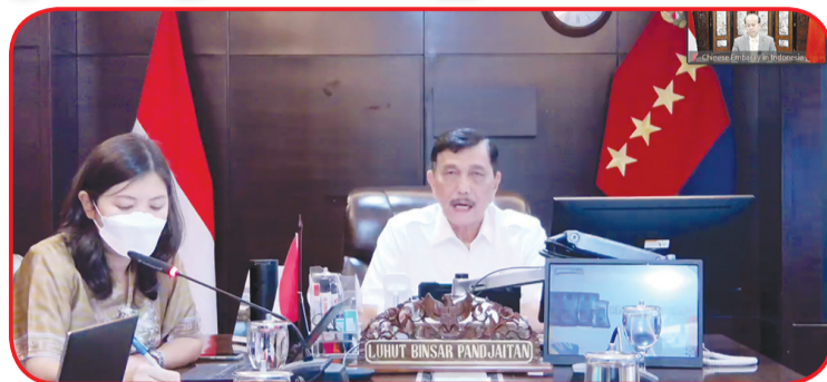
Menko Marves RI Luhut B Panjaitan.