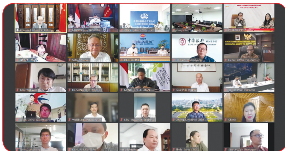
Para tokoh yang hadir dalam Video Conference Kerjasama Anti Epidemii Tiongkok-Indonesia.

Luhut menyatakan terima kasih kepada pemerintah dan perusahaan China yang telah memberikan dukungan kepada masyarakat Indonesia dalam memerangi pandemi Covid-19.