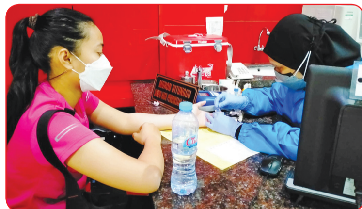
Calon pendonor diperiksa kesehatannya oleh petugas medis.