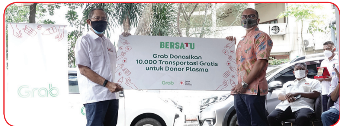
Penyerahan secara simbolis bantuan dari Grab untuk PMI.

"Bantuan dari Grab sangat krusial dalam memenuhi kebutuhan pasokan oksigen saat ini. Pemerintah berterima kasih atas peran aktif Grab sejak awal pandemi, diantaranya sebagai mitra swasta pertama untuk program vaksinasi nasional. Kami juga mengajak seluruh masyarakat Indonesia untuk terus saling membantu dan lebih disiplin mentaati protocol Kesehatan." ujar Menkes. • bam