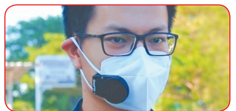
Clippo alat penjepit pengeras suara pada masker.