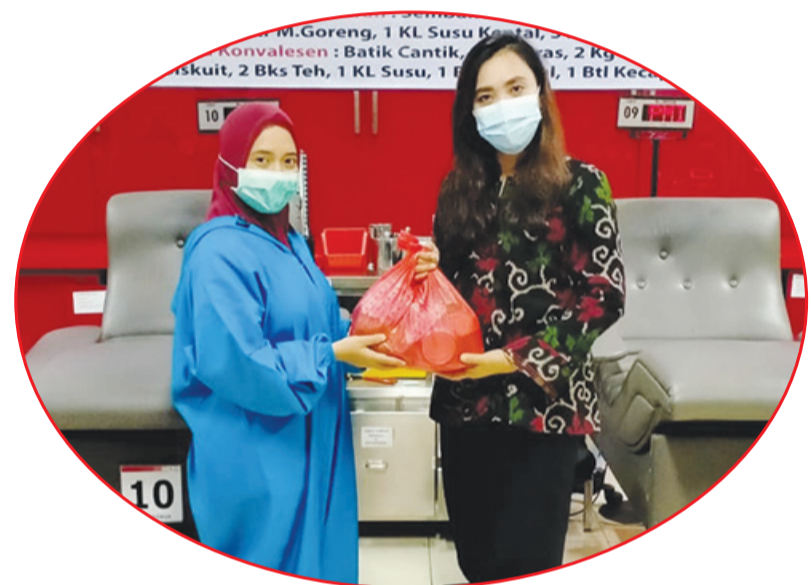
Penyerahan paket sembako untuk pendonor.