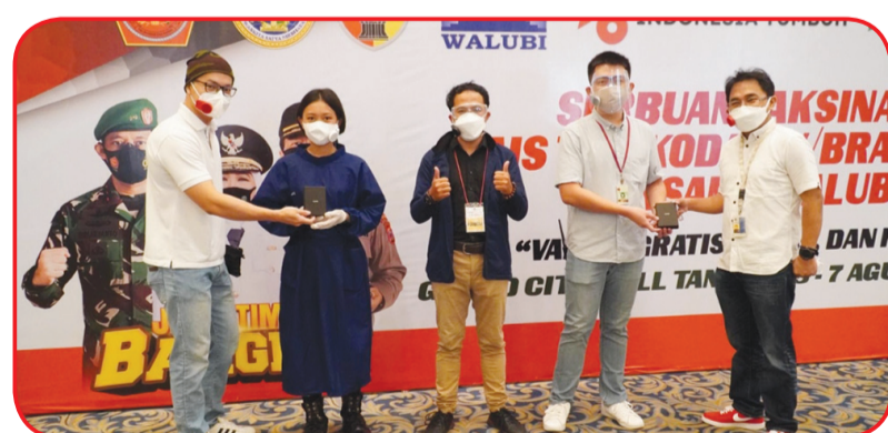
Penyerahan Clippo untuk Nakes di Grand City.

“Saat ini kita dihimbau untuk menggunakan double masker, sehingga memerlukan