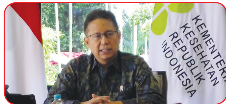
Menkes Budi Gunadi Sadikin

JAKARTA (IM) - Menteri Koordinator Bidang Kemaritiman dan Investasi Luhut B Panjaitan, Selasa (3/8) lalu menyelenggarakan Video Conference mengenai kerjasama anti-epidemi Tiongkok-Indonesia.