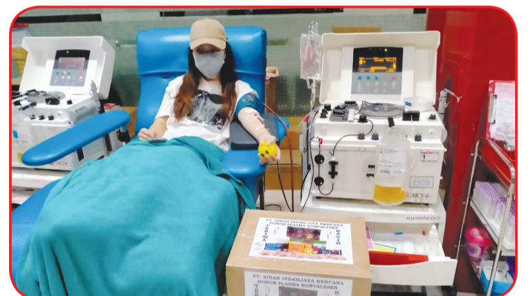
Seorang peserta pendonor plasma konvalesen.